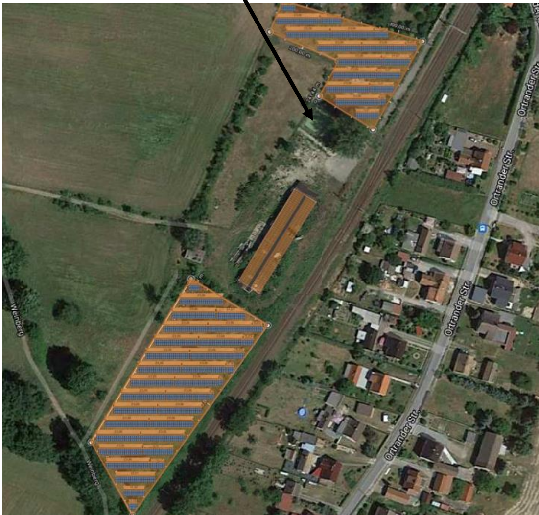
Abb. 1: Modulbelegungsplan

Auf der Fläche (Gesamtgröße ca. 1,38 ha) sollen Photovoltaikanlagen aufgestellt werden. Es handelt sich um eine teilweise brach liegende Fläche, auf der sich zwei baufällige und ungenutzte Gebäude (ca. 750 und 110 m 2 ) befinden. Das größere Gebäude soll so ertüchtigt werden, dass die Aufstellung von Anlagen auf der Dachfläche möglich wird. Für die Aufstellung der Photovoltaikanlagen auf dem restlichen Gelände muss der Bewuchs auf den beiden Teilflächen nördlich und südlich des Gebäudes beseitigt werden. Der vorhandene kleine Feuerlöschteich bleibt erhalten.