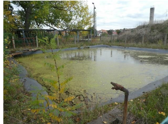
Fotos 9 und 10: Feuerlöschteich aus südwestlicher und nordöstlicher Richtung