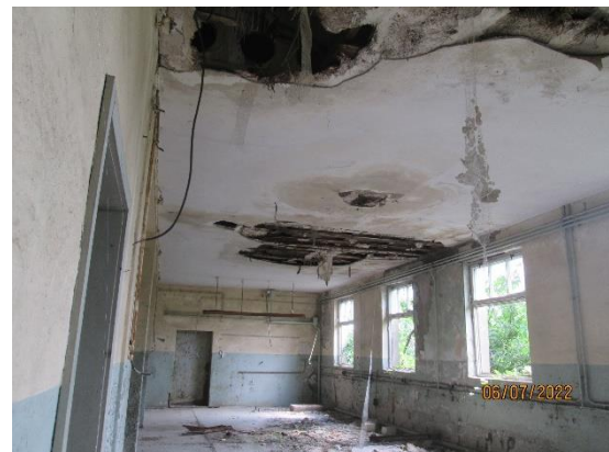
Foto 18 defekte Deckenverkleidung

Gemäß Aussagen der unteren Naturschutzbehörde ist die Streuobstwiese westlich des Vorhabens vor der ehemaligen Gaststätte bekannt für eine hohe Fledermausaktivität (vgl. Besprechungsprotokoll in Anlage 1).