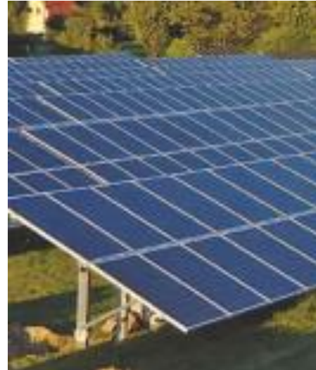
Abb. 3: Aufbaubeispiel