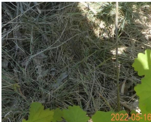
sFoto 19: Weibchen

Beobachtungen: 11.50 Uhr und 12.00 Uhr am hinteren Schuppen, jedoch ohne direkte Sicht 12.22 Uhr – 1 Weibchen etwa Mitte Gebäude Rtg. Bahn 12.40 Uhr – 1 Weibchen an vorderer Hausecke (Foto 19) 12.46 Uhr – 1 Jungtier am Zaun