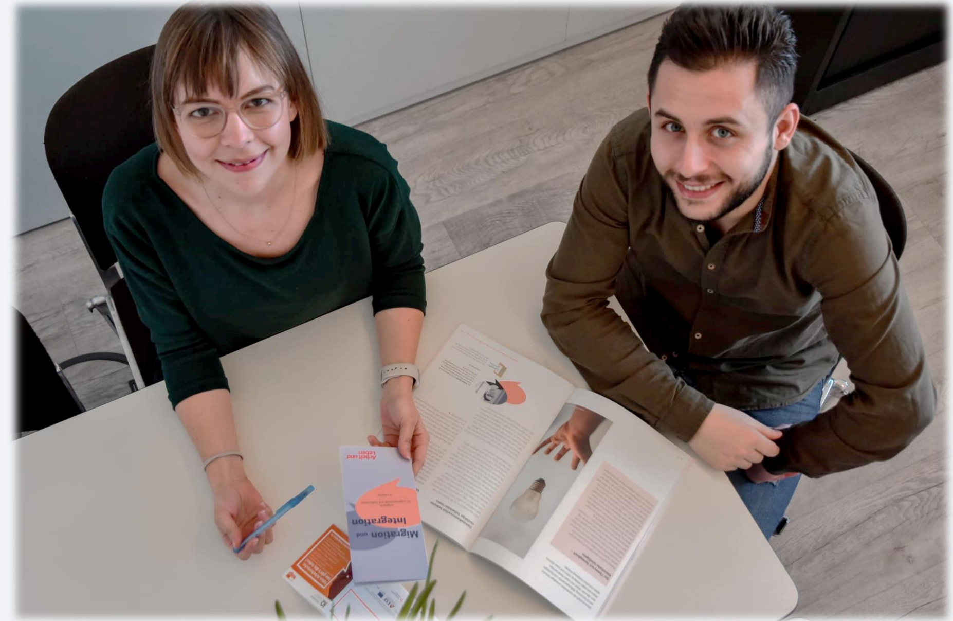
Faire Integration Sachsen