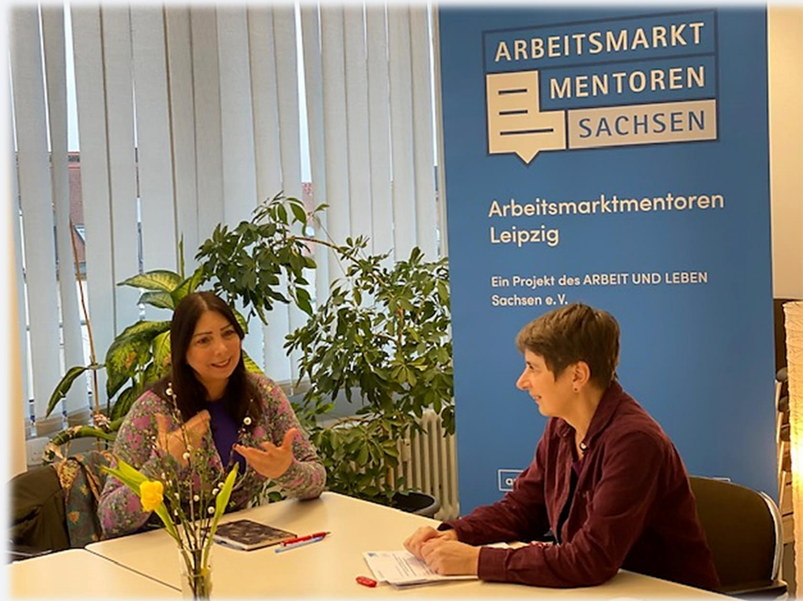
Arbeitsmarktmentoren in Leipzig und Dresden

– Blitzlicht aus den Projekten bei Arbeit und Leben Sachsen e.V. –